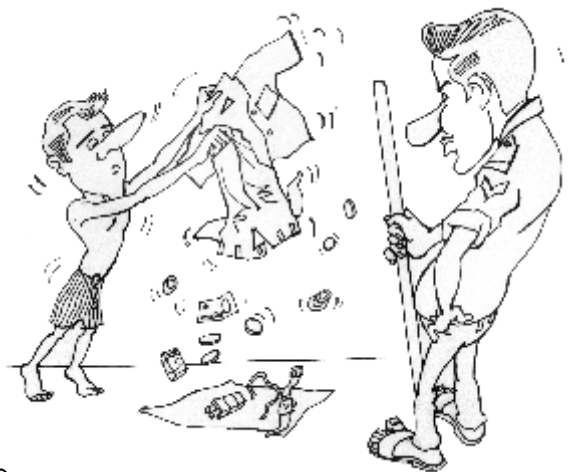
पुलिस द्वारा रखे गए सामानों के लिए रसीद जारी करना अनिवार्य है

व्यस्त थे कि दादाजी आए और उन्होंने नीता का कंधा थपथपाया। वह शांतिपूर्वक लोगों की बातें सुन रहे थे। इमरान ने दादाजी से कहा, “अब हम समझ गए हमारे अधिकार क्या हैं और मुझे विश्वास है हम भविष्य में पुलिस को हमारे साथ दुर्व्यवहार करने से रोक सकेंगे।”