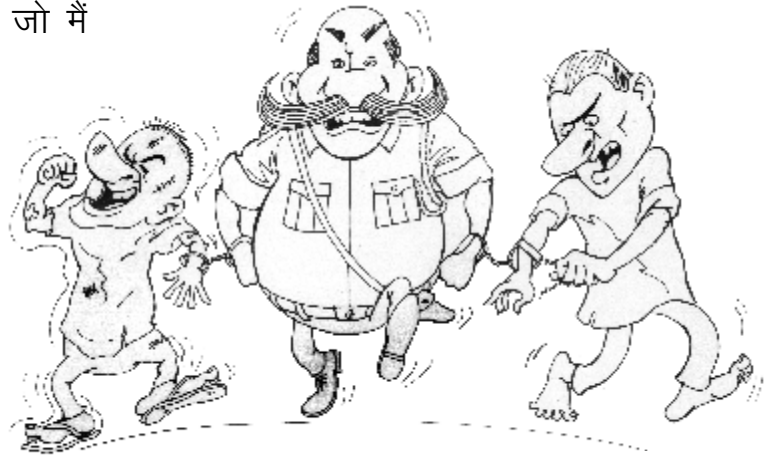
पुलिस द्वारा हथकड़ी के उपयोग के पीछे शर्त है

“कुछ और भी बातें हैं जो मैं तुम लोगों को बताना चाहती हूं। मैं बताना चाहती हूं कि गिरफ्तारी करने वाले पुलिस अधिकारी का यह कर्तव्य है कि वह नाम पट्टी पर अपनी सही-सही पहचान बताएं जो सुस्पष्ट हो और जिसमें उसका पदनाम उल्लिखित हो”,